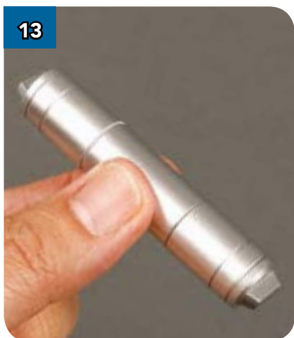
13 Готовое устройство должно выглядеть так, как показано на фотографии.