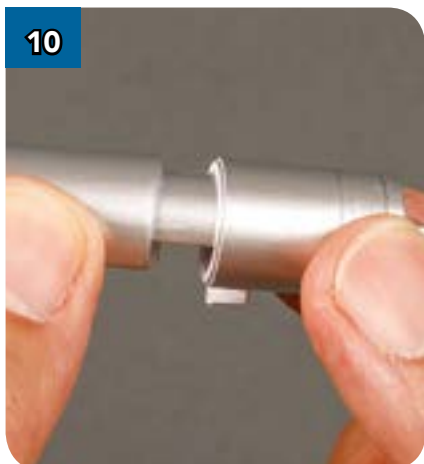
10 Поднесите одну из собранных конструкций к концу детали (BP-39) так, как показано на фотографии.