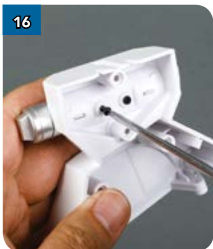
16 ...и закрепите его двумя саморезами 2,3 x 6 мм, закрутив их так, как показано на фотографии.

ГОТОВАЯ ДЕТАЛЬ Так должна выглядеть ваша правая накладка средней опоры.