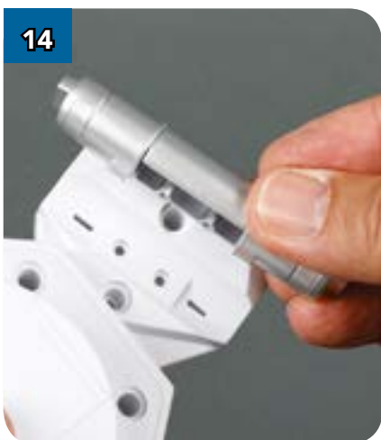
14 Поднесите собранное устройство к накладке (BP-61), чтобы его штифты и выступы совпали с соответствующими отверстиями накладки.