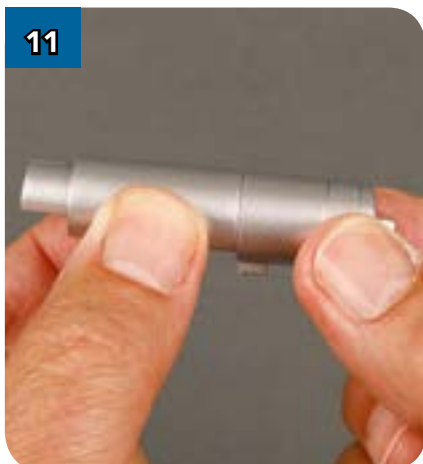
11 Плотно соедините обе детали.