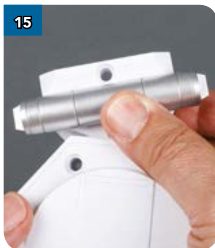
15 Нажав, вставьте смазочное устройство на место...