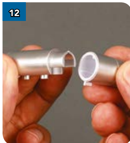
12 Аналогичным образом соедините с деталью (BP-39) другую собранную вами конструкцию.